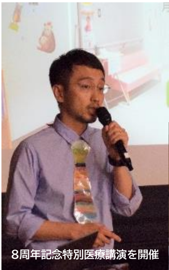
8周年記念特別医療講演を開催