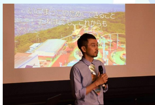
講演後に参加者の皆様から質問も飛び交いました。