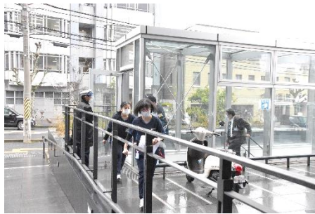
非常出入口から避難