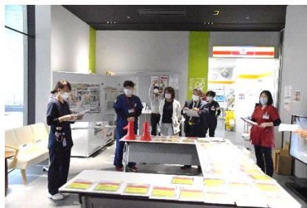
災害本部設置・アクションカード配布