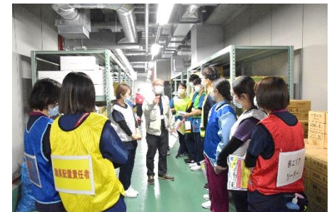
備蓄倉庫内物品確認