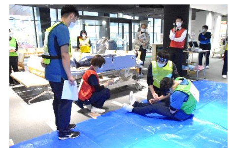
参加職員のトリアージ体験