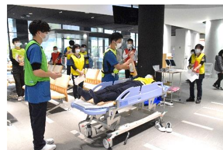
救命士によるトリアージタグの説明