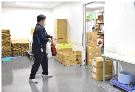
第一発見者による初期消火