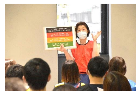
高岸外科部長による、災害講義