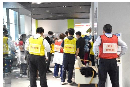
役割別にビブス着用