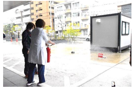
水消火器での消火訓練