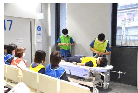
傷病者トリアージデモ